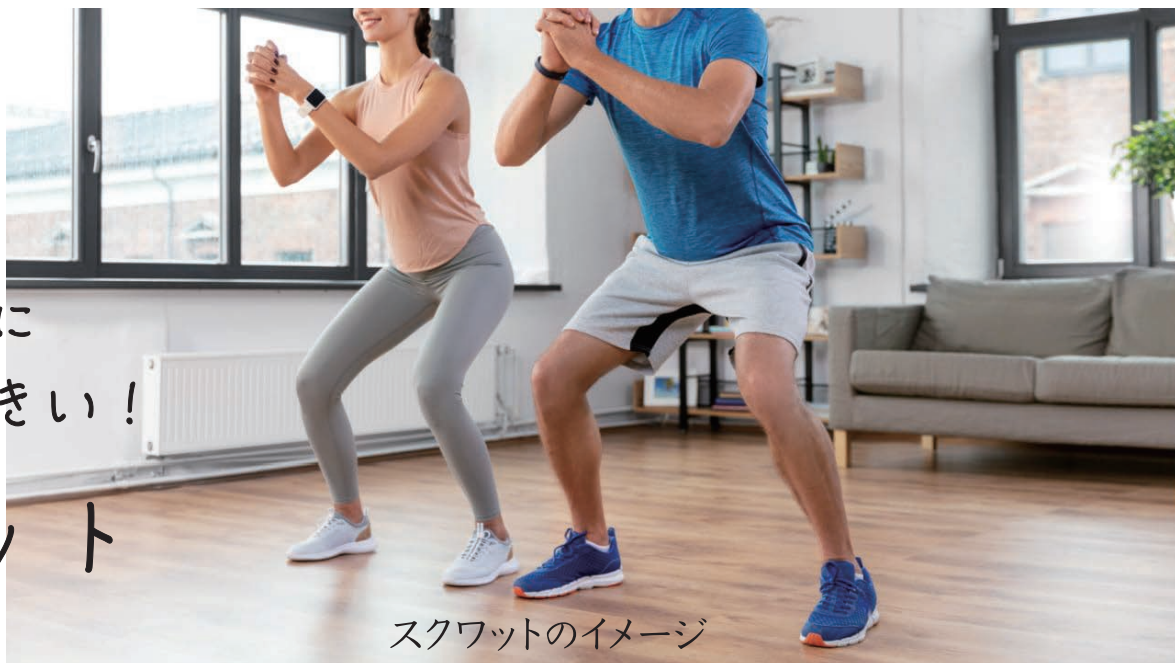
スクワットのイメージ

しゃがむ動作を繰り返すだけで、健康効果が大きいスクワット。全筋肉のうち60%以上が下半身にあり、人体移動というおおきな働きなどをしていて、その筋肉を動かす運動がスクワットです。しゃがむという単純に見える動作の場合、股関節・膝関節・足関節など、同時に多くの関節を動かします(多関節運動)。この運動をおこなうために何種類もの筋肉が使われています。このほか、足の裏、足の甲、脛、胸、首など、ほぼ全身の筋肉がスクワットで使われます。それだけにスクワットはエネルギー消費量が高い運動です。これら重要な筋肉は、歩いたり走ったりするだけでは十分に作用しません。スクワットのように膝を90度に曲げ、体重をしっかりとかけたときに強い刺激を受け、より大きい筋肉へ変化するのです。単純なのに健康効果が大きいスクワットはおすすめです。